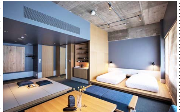
モデュレックスの施工事例「KUMU金沢」の客室

これまでの概念を変えるモデュレックスの照明器具(右の上・下)とライティングソリューションセンター金沢